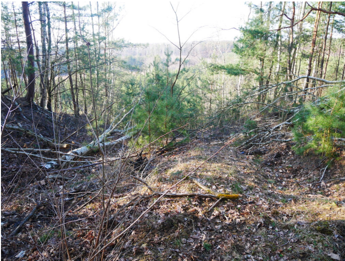
Skihang Hochkippe Brieske