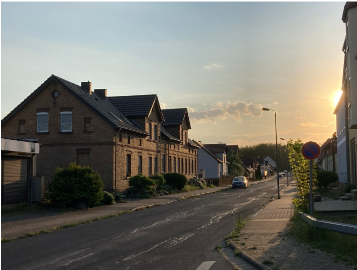
Siedlung Brikettfabrik