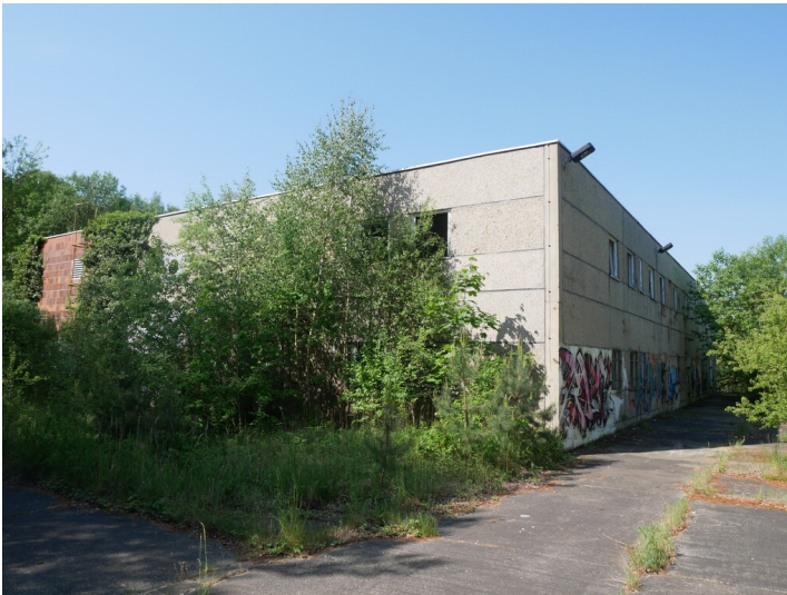
Umformerstation des Kraftwerks Sonne