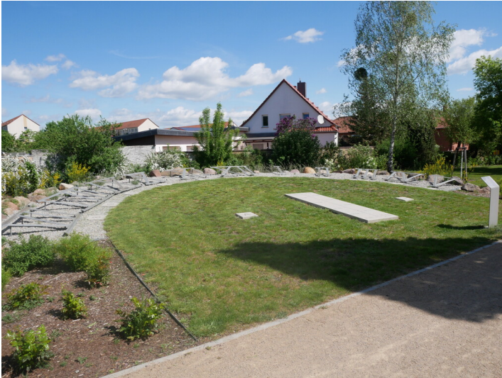
Analematische Sonnenuhr