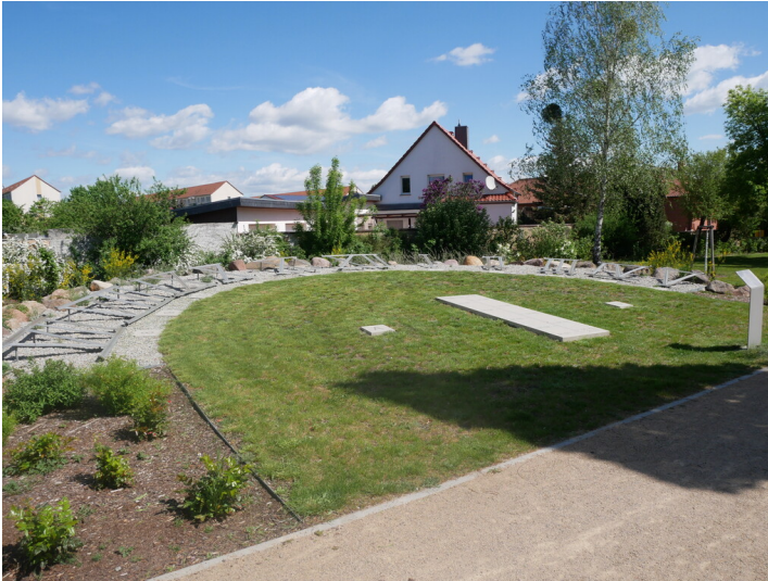
Analematische Sonnenuhr