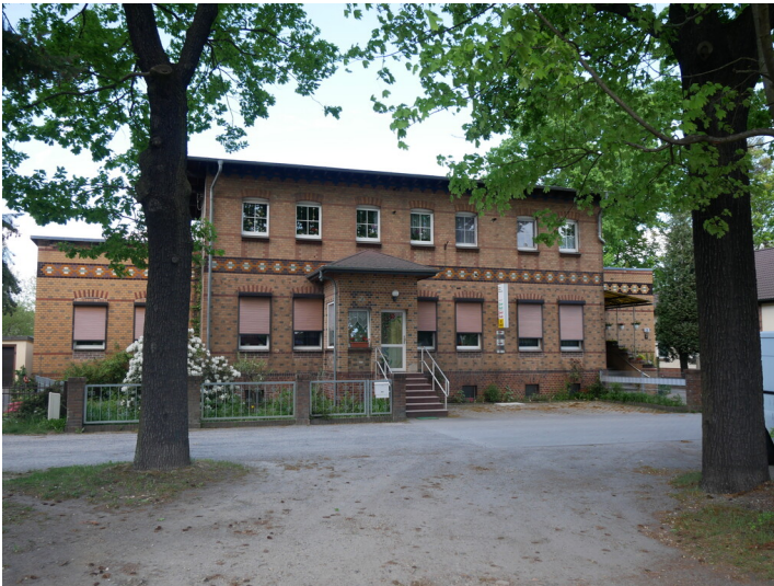
Wohn- und Geschäftshaus der Hoffmannschen Ziegelwerke