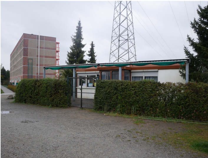
CafÄ© Großräschen