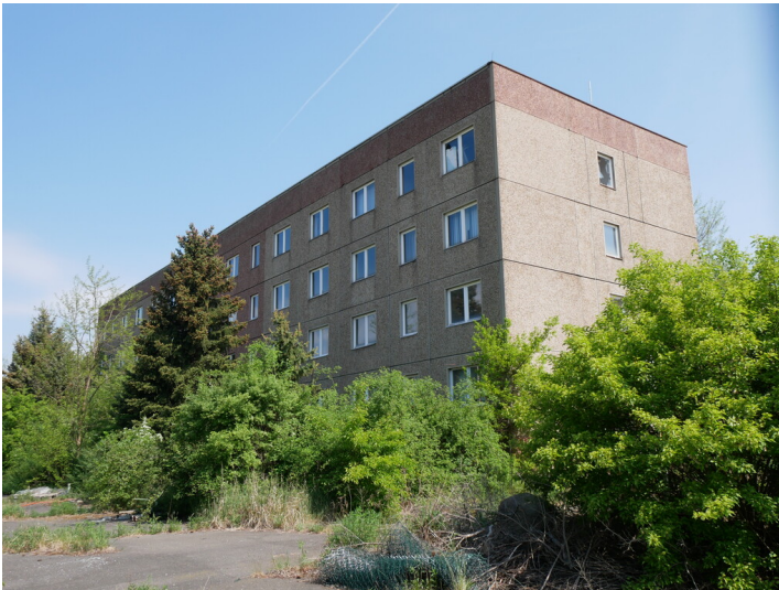
Verwaltungsgebäude Tagesanlagen Meuro