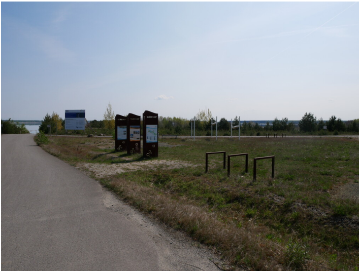
Anlegestelle und Löschwasserentnahmestelle Sedlitz