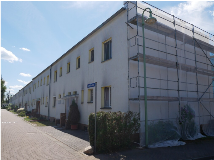
Gewoba-Siedlung Großräschen