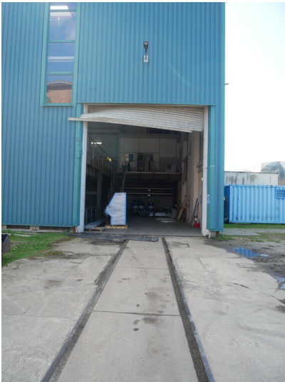
Maschinenhaus des Kraftwerks