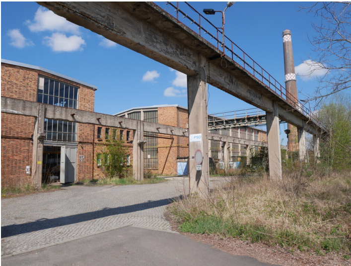
Werkstätten der Brikettfabriken Sonne I und Sonne II