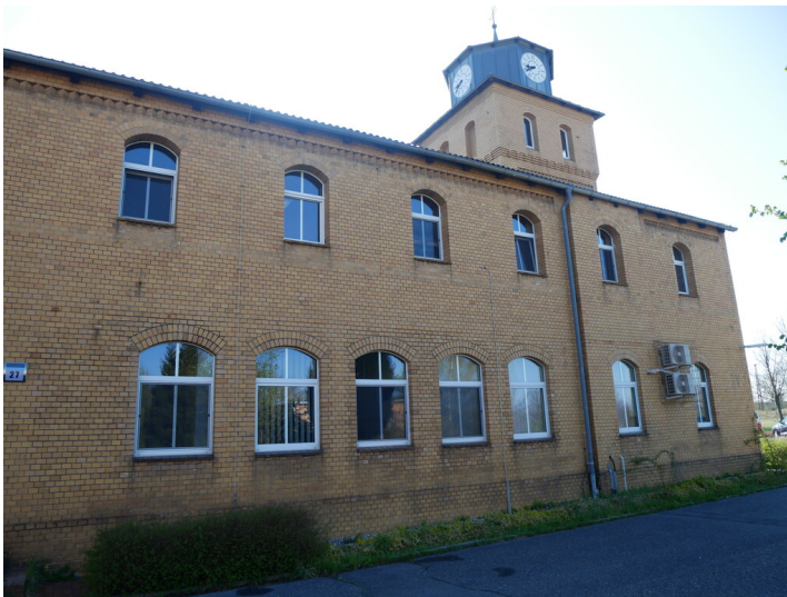
Verwaltungsgebäude der Brikettfabriken Renate und Eva