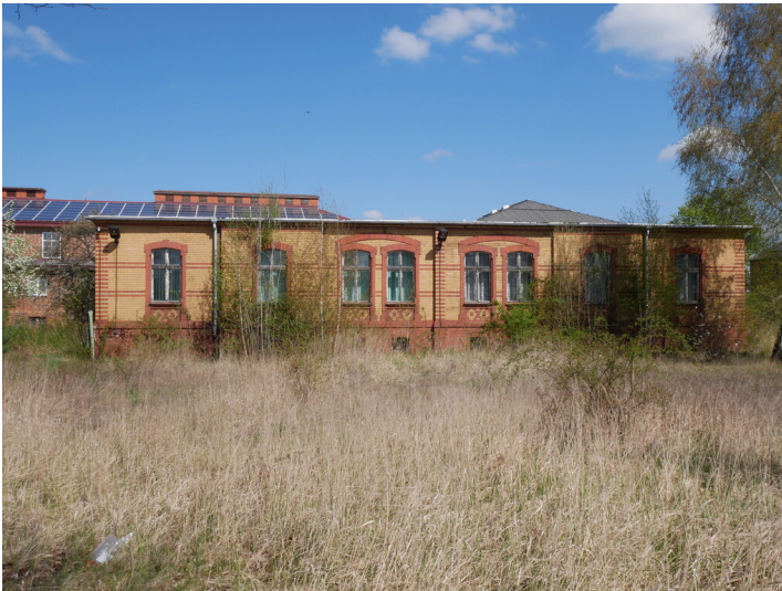
Kontorgebäude der Brikettfabriken Renate und Eva