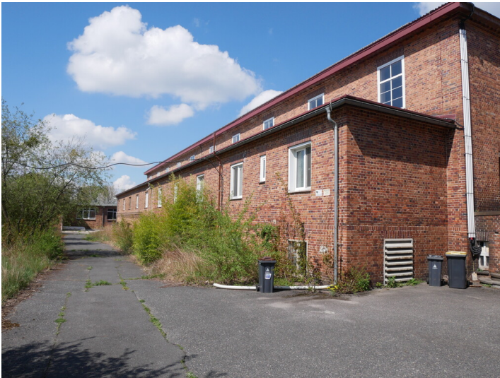
Kaue der Brikettfabriken Renate und Eva