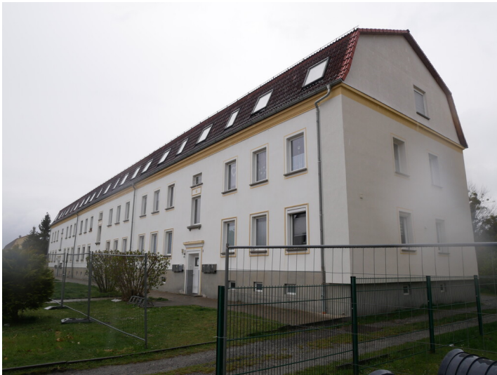
Siedlung Mühlenstraße Erweiterung