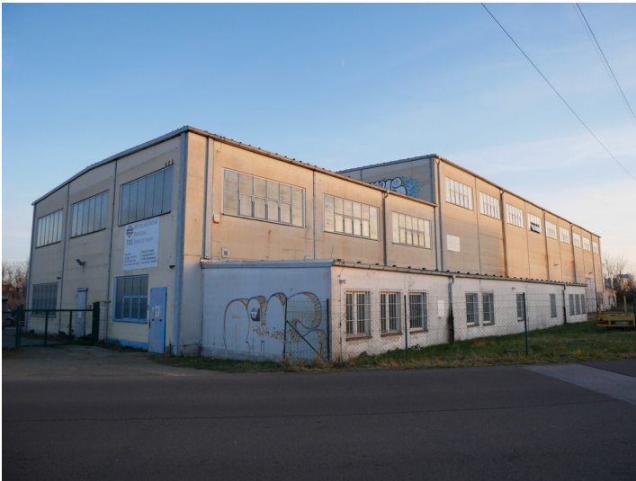
Werkstattkomplex Impuls