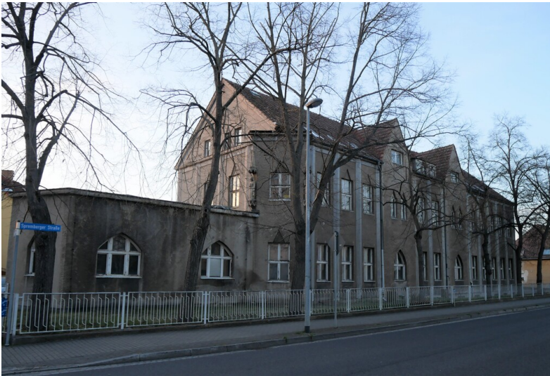
Verwaltungsgebäude der Halleschen Pfännerschaft AG