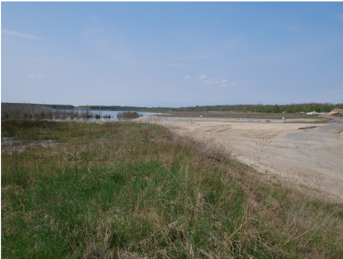
Marina Sedlitz