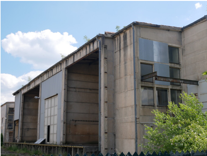
Umspannwerk des ehemaligen Kraftwerks Marga