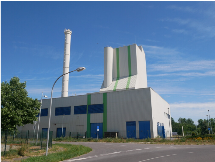
Heizwerk Gewerbegebiet Grubestraße