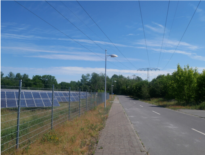
Solarpark im Gewerbegebiet Grubenstraße