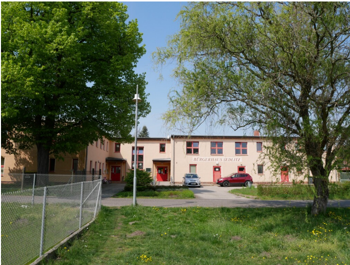
Kindergarten und Bürgerhaus Sedlitz