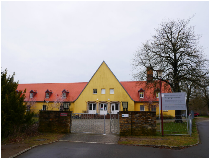
Lehrlingswohnheim BKK Senftenberg