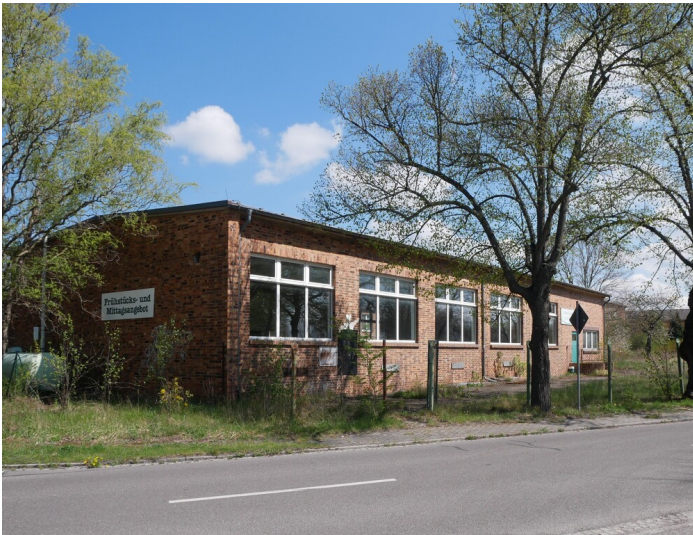
Kantine der Brikettfabriken Sonne I, Sonne II und des Kraftwerks