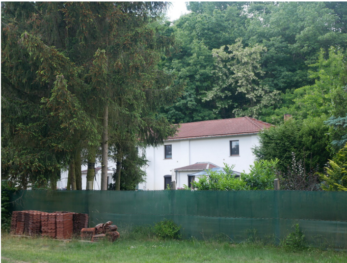
Siedlung nördlich der B169