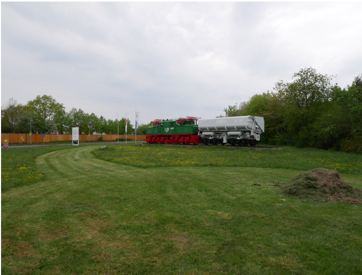
Grubenbahn auf der Grünfläche zwischen Elsterstraße und Klein Koschener Straße