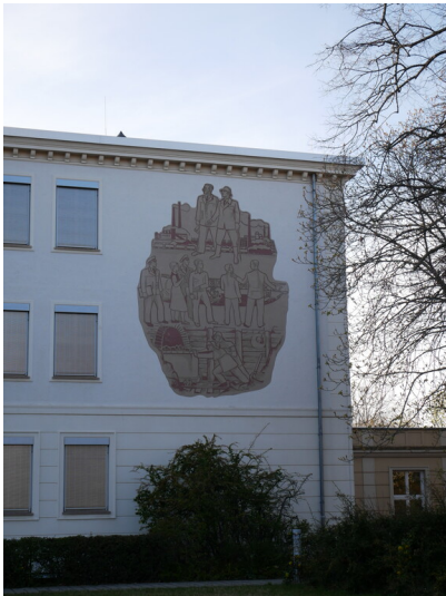
Wandbild Geschichte des Bergbaus