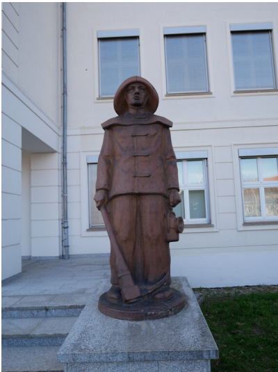
Bergmann der Bergingenieurschule Senftenberg