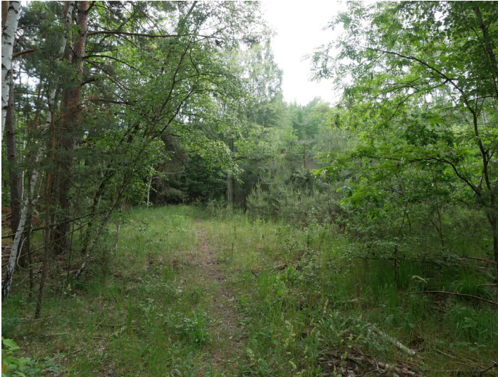
Stromversorgung Pumpstation Marienteich-West