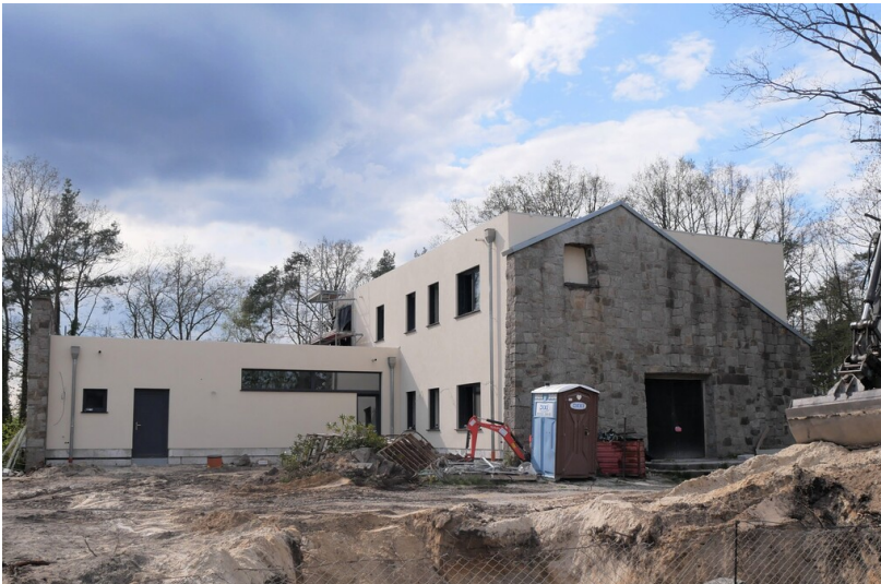
Kapelle Maria Regina Gloriosa