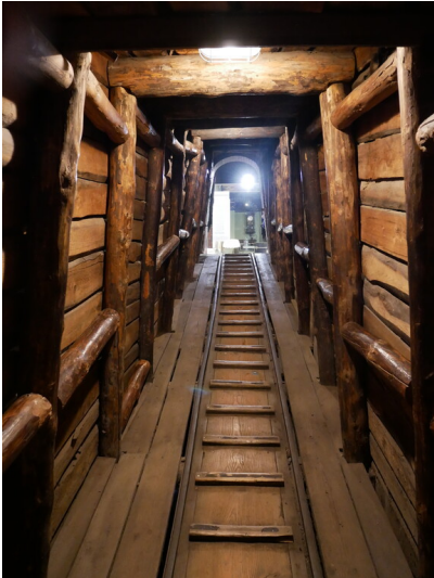
Museum Schloss und Festung Senftenberg