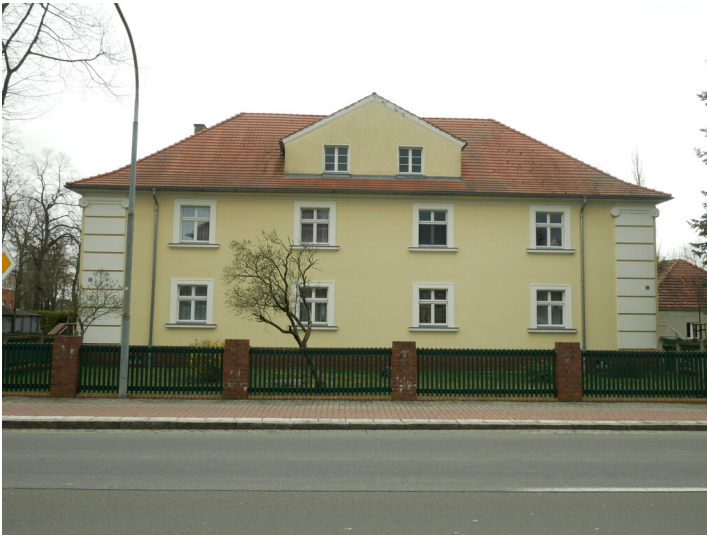
Wohngebäude der Kolonie Marga