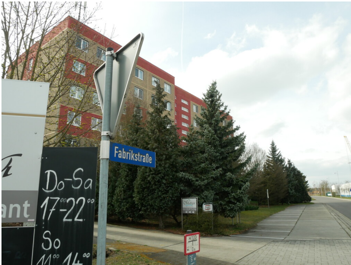
ehem. Werkverwaltung