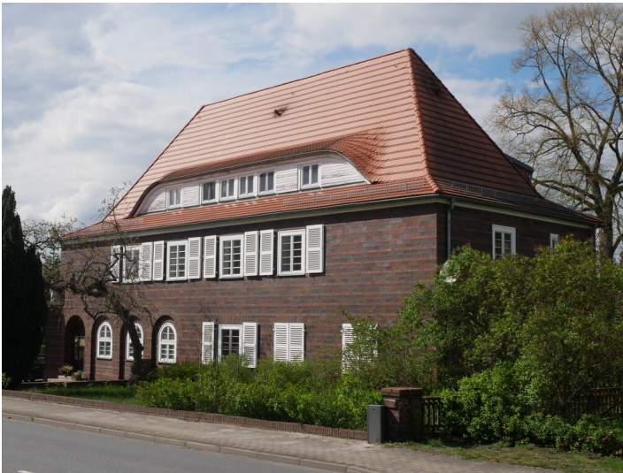
Gemeindeamtsgebäude Freienhufen