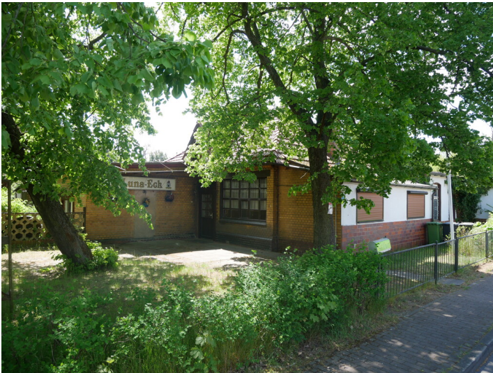
Lunaeck im Lunapark Großräschen