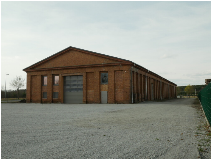
Werkstattengebäude am westlichen Rand des Industrieparks Marga