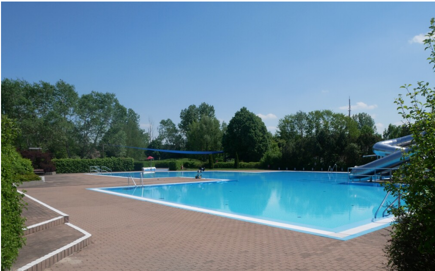
FEZ Großräschen