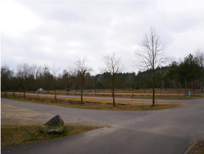
Parkplatz am westlichen Senftenberger Seeufer