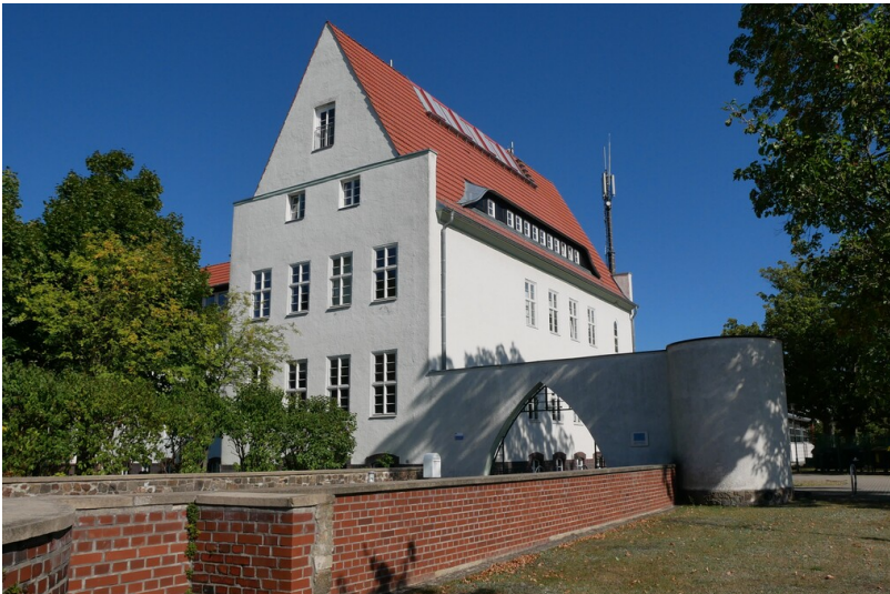
Schule Sedlitz