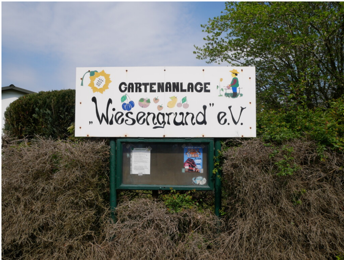
KGV Wiesengrund