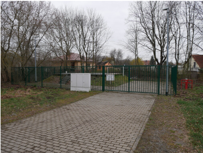
Horizontalbrunnen 4 - Bertha