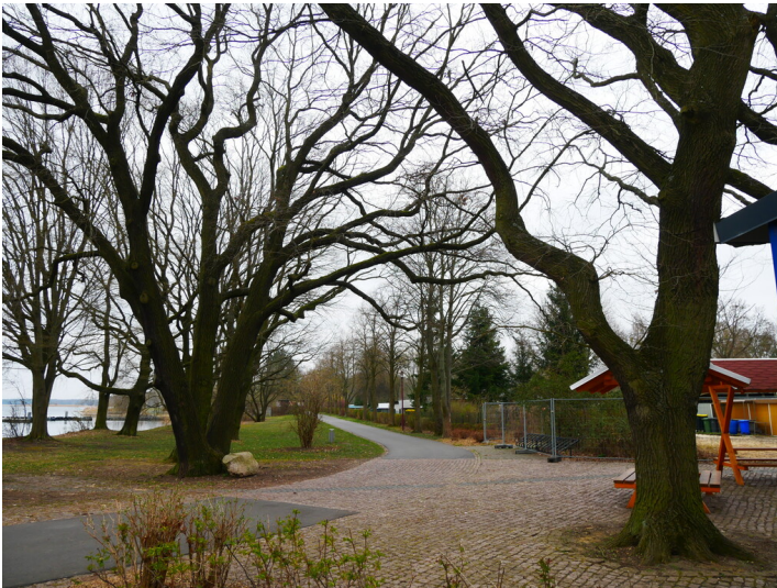
Bad Niemtsch