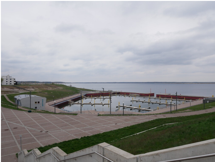
Großräschener Hafen