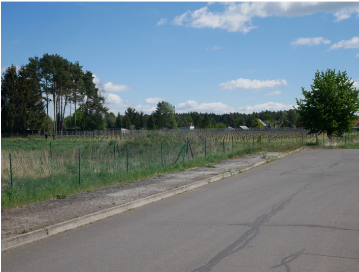
Weinberg an den IBA-Terrassen