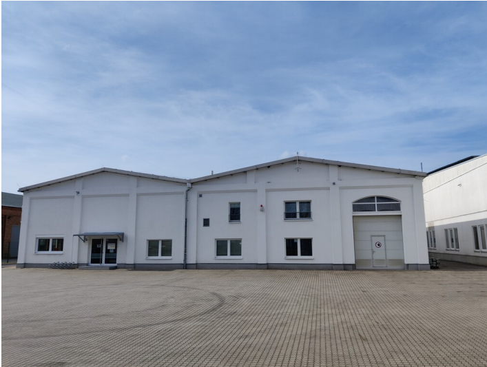
Gebäude der pluralis GmbH