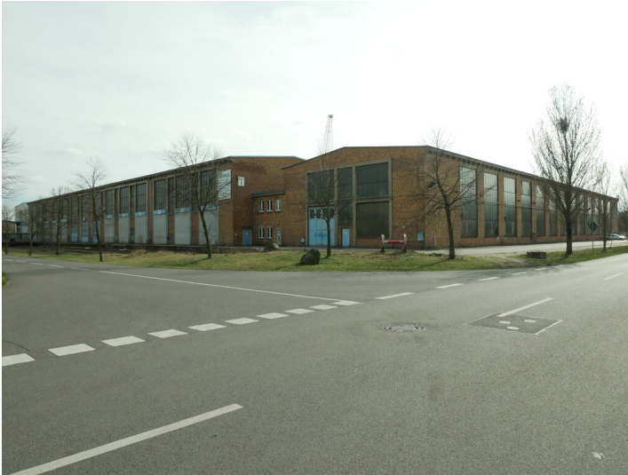
Industriepark Marga