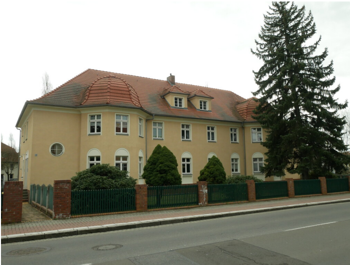
Wohngebäude in Erweiterung der Kolonie Marga