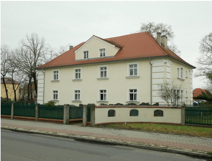
Wohngebäude der Kolonie Marga