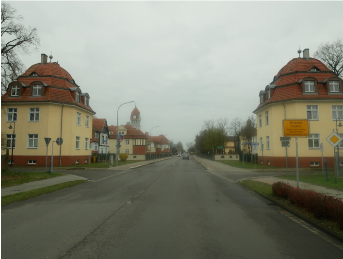
Torhäuser der Kolonie Marga