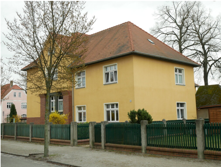
Wohngebäude der Kolonie Marga